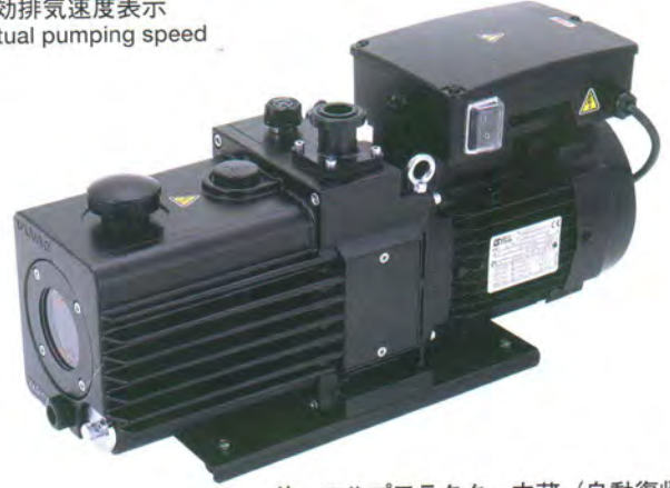
サーマルプロテクター内蔵 (自動復帰) With built-in thermal protector