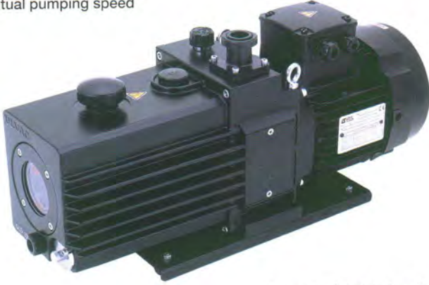
サーマルプロテクターなし Without thermal protector